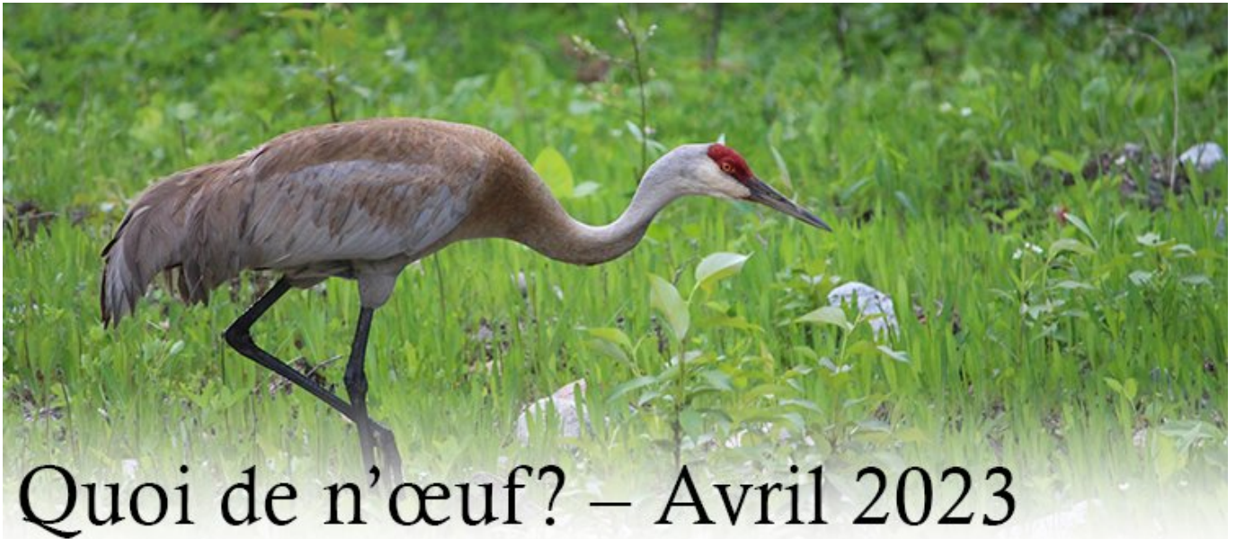
Grue du Canada