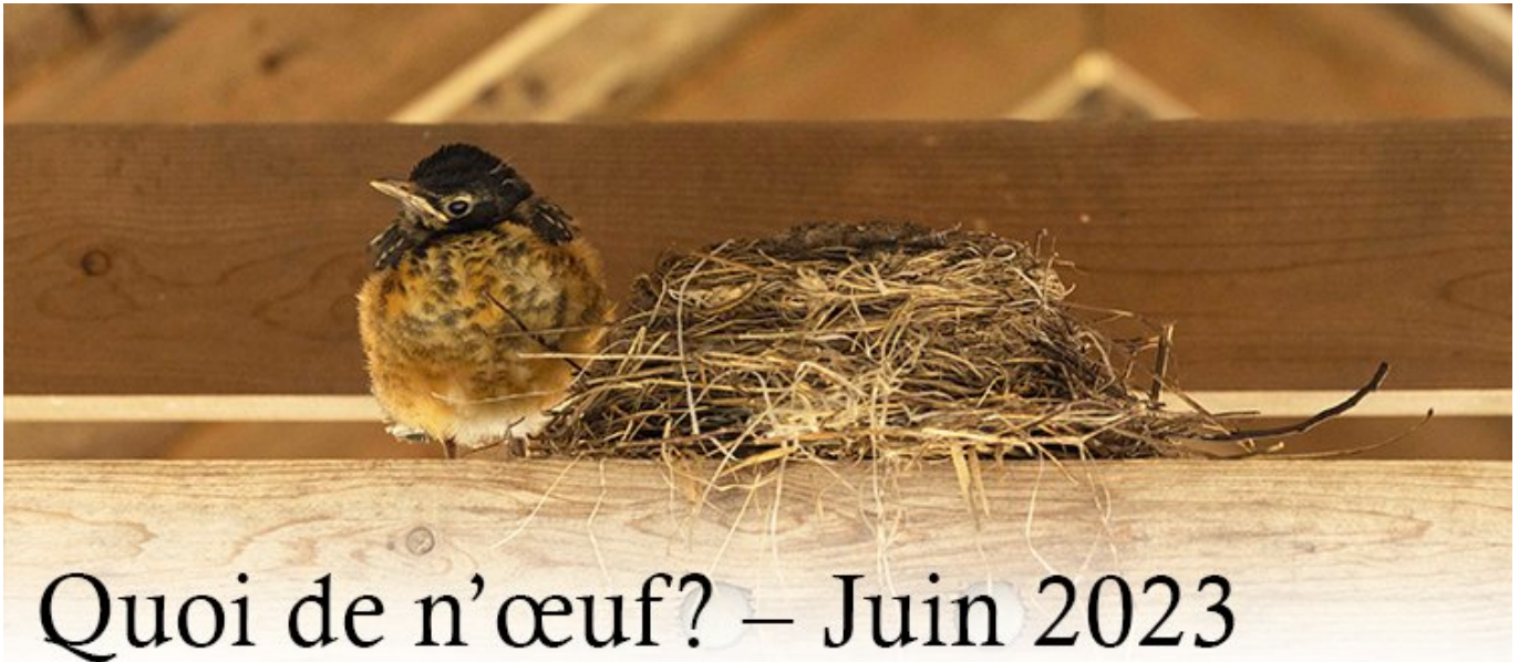
Merle d'Amérique